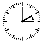
Umstellung Frühling Uhr wird vorgestellt